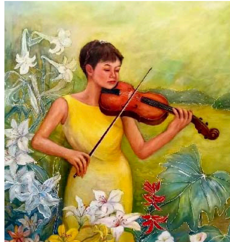
「歌に力を」 松井 京子 油彩 F100