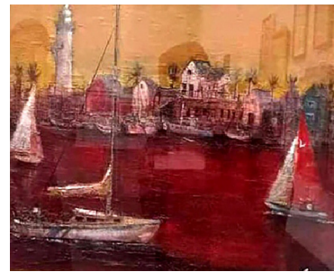
「暮色(マリーナデルレイ)」 井上 勇 油彩 F 20