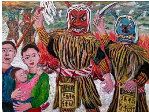
「男鹿半島、なまはげ祭」 野中 久 油彩 F80